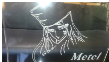
④メーテルアクリルパネルイメージ