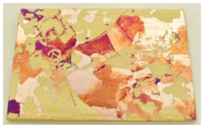
②木製ポストカード