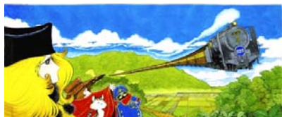
①プロジェクトイメージ 「銀河鉄道999 心の古里 新谷」

「銀河鉄道999」などの作品で多くのファンを持つ漫画家 松本零士氏と愛媛の若手職人グループが コラボレーションしたモノづくりのご紹介をいたします。