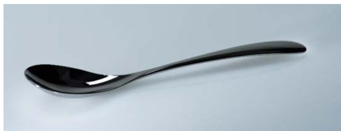
「saku」サクー（全長：約198mm）各¥1,250+税