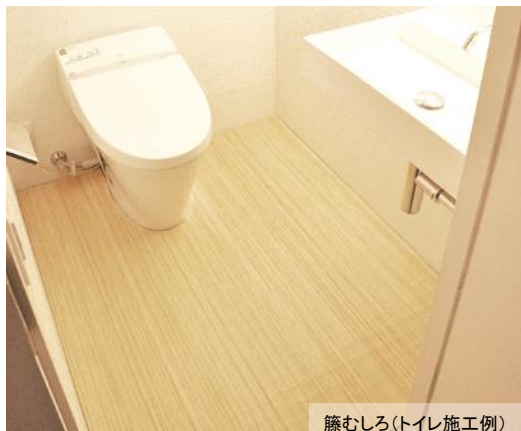
籐むしろ(トイレ施工例)