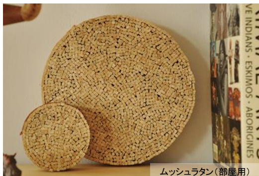
ムッシュラタン(部屋用)