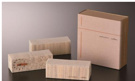
ムッシュラタン(冷蔵庫用)

会 期：2018年6月7日（木）～2018年6月19日（火） 10:30 - 19:00 /最終日は17:00迄 水曜定休 入場無料 会 場：monova gallery 場 所：東京都新宿区西新宿3-7-1 リビングデザインセンターOZONE 4階 主 催：monova / 協 力：有限会社 野々山籐屋