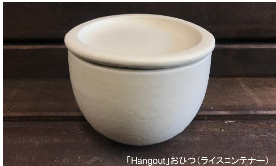
「Hangout」おひつ(ライスコンテナー)