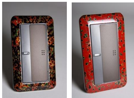
津軽塗ペンダントランプ 呂・赤(写真左)

津軽塗は、300年以上受け継がれてきた青森県の伝統工芸です。漆を何層にも重ねて塗り、研ぐという繰り返して生まれる、個性的で迫力のある模様が特徴です。津軽燈LABが提案するペンダントランプは、すっきりしたシャープな形と津軽塗の奥ゆかしい伝統模様が組み合わせ、アクセントとして取り入れやすいデザインです。オリジナルスイッチパネルと併せたコーディネートもお楽しみください。