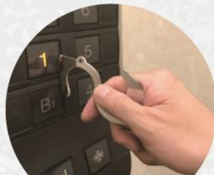
エレベータの ボタン