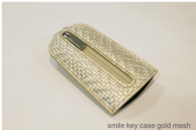
smile key case gold mesh