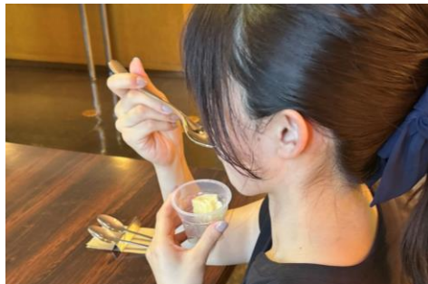
【カトラリー口抜け体験 イメージ】