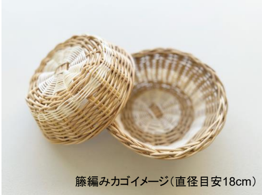
籐編みカゴイメージ(直径目安18cm)