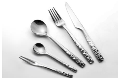
【カトラリーイメージ「YUEN」】