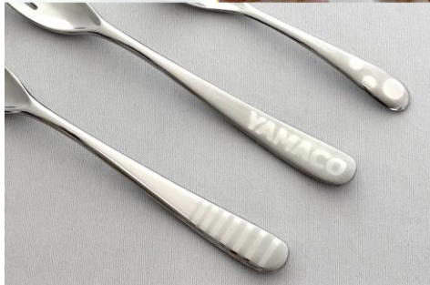
【カトラリー手磨き体験 イメージ】